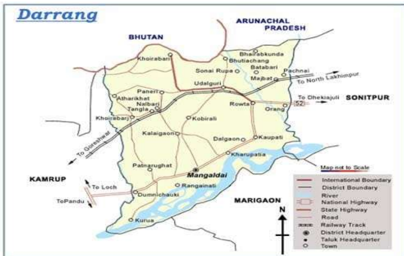
Map of Darrang District

The district Darrang in central Assam is situated on the north bank of the river Brahmaputra. Darrang District extends from 20°09' N to 26°95' N of North latitude and 91°45' E to 92°22' East longitude. Darrang, one of the biggest districts of Assam from the days Mahabharata had its historical antiquity. The present Darrang District was a sub-division of the earlier undivided Darrang District. Sub-division Mangaldai is the district headquarter now. Agriculture is the main source of livelihood. The main agriculture products are paddy, mustard, jute, maize, wheat, sugarcane and tea. Darrang District has the land area of 1850.58sq. km and total population is 908,090 according to census report 2011.