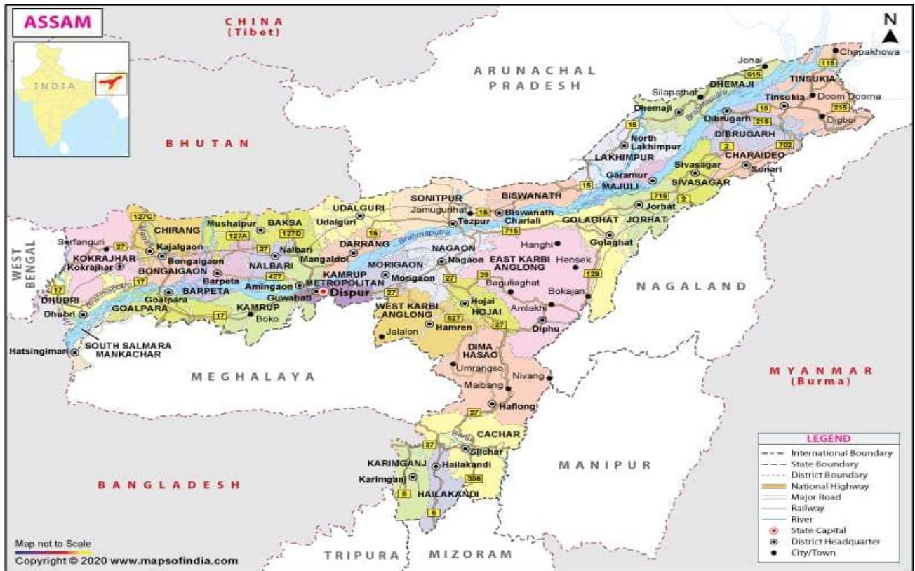
Map of Assam