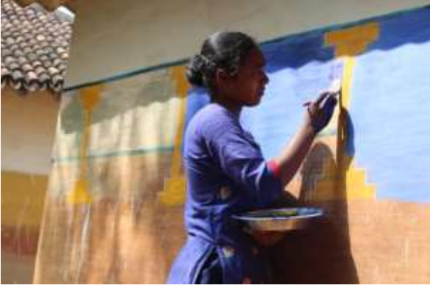
দেওয়ালচিত্র অঙ্কনরত নারীশিল্পী