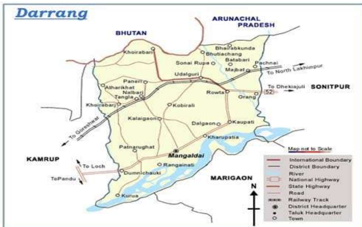
Map of Darrang District

The district Darrang in central Assam is situated on the north bank of the river Brahmaputra. Darrang District extends from 20°09' N to 26°95' N of North latitude and 91°45' E to 92°22' East longitude. Darrang, one of the biggest districts of Assam from the days Mahabharata had its historical antiquity. The present Darrang District was a sub-division of the earlier undivided Darrang District. Sub-division Mangaldai is the district's headquarters now. Agriculture is the main source of livelihood. The main agricultural products are paddy, mustard, jute, maize, wheat, sugarcane, and tea. Darrang District has a land area of 1850.58 sq. km and a total population of 908,090 according to the census report of 2011.