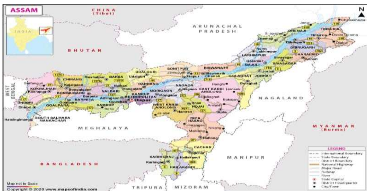
Map of Assam

Char areas women are mostly illiterate. So the study has been carried out by observations. The entire Muslim and Bengali women of Darrang District of Assam constituted as population of my study. Data has been collected from the both primary and secondary sources.